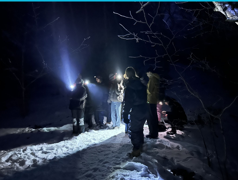
Sansedag i Fosdalen med UngJam