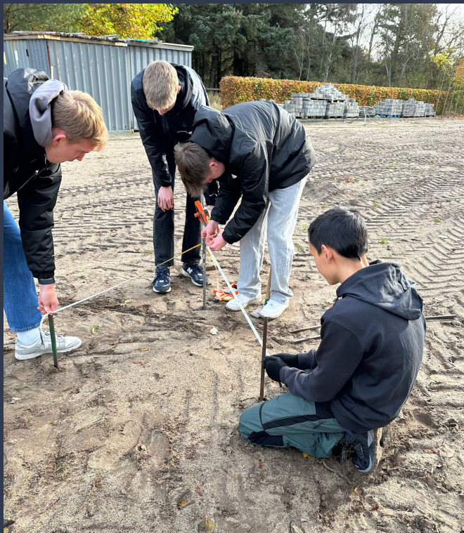
Besøg på Sandmoseskolen